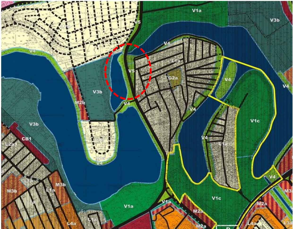
Extras din PUZ Sector 2, aprobat prin HCL 99/2003, în prezent expirat

Terenul cu nr cadastral 202156 este încadrat în cadrul Planului Urbanistic Zonal Sector 2 București, aflat în etapa de avizare, în subzona V5 - Culoare de protecție față de infrastructura tehnică.